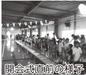
開会式直前の様子 みんな緊張しています