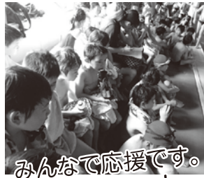
みんなて応援です。 がんばれ～!