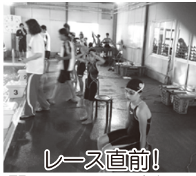
レース直前! 緊張していますね～

6月1日(日)に筑後スイミングスクールにて第5回廣重杯が開催されました。小郡スイミングスクールからは、選手クラス一般クラス合わせて29名の選手がエントリーし、白熱したレースが展開されました。今回一般クラスから日頃行われているタイムトライアル(5B級以上対象)のTOP5の選手を選抜して試合に臨み、見事期待に応えて力泳を見せてくれました。今回の試合には、皆さんも参加できるように日々の練習を頑張ってくださいと思います。次回のタイムトライアルは、7月22日(火)～28日(月)です。練習休まず頑張ります!!